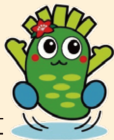
奥多摩町イメージキャラクター わさぴー