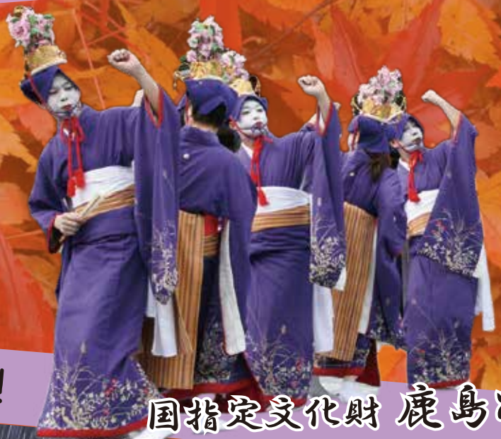
国指定文化財 鹿島踊り